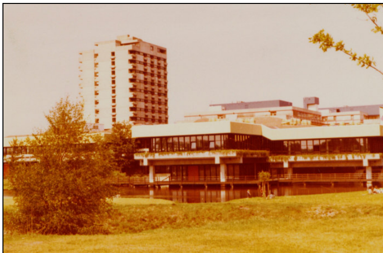
Foto: M. Wulf (Universität Bremen, Blick auf alte Mensa und NW2-Gebäude, 1981)

Jahrestagung der GfÖ in Bremen vom 11.09. bis 15.09.2006